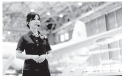
▲あいち航空ミュージアム 指定管理者:名古屋空港ビルディング株式会社 運営業務受託会社:凸版印刷株式会社と同社

現在は、個人入館料の 20% 割引も行っているの、お得に見学できるチャンスです。(取材:堀)