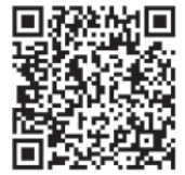
通信教育講座一覧