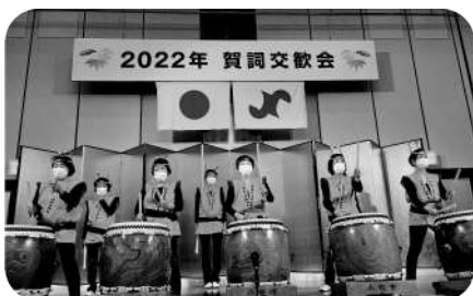
▲女性会太鼓演奏の様子