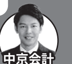
中京会計 伊藤圭太税理士事務所

チラシ折込サービスでは、会員サービスの一環として、会員事業所のチラシを会報へ同封し、当所会員事業所の他、関係官公庁、他地区商工会議所など約3,500件へ配布しPRすることが可能です。