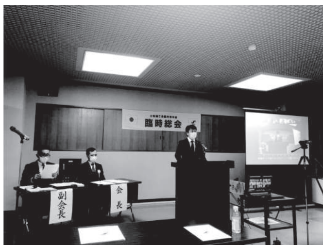
▲対面とオンラインを併用した会議のようす